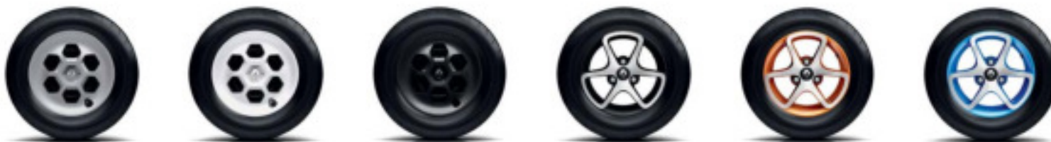
Enjoliveur gris (série) (2)