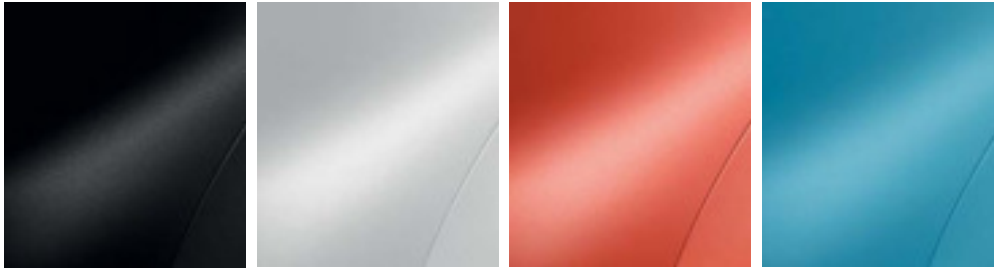
Noir Étoilé (1)