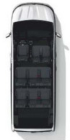
Configuration 9 places