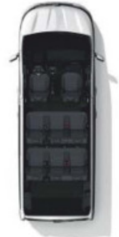
Configuration 8 places