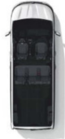
Configuration 5 places