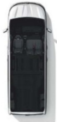
Configuration 3 places