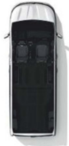
Configuration 2 places