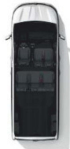
Configuration 6 places